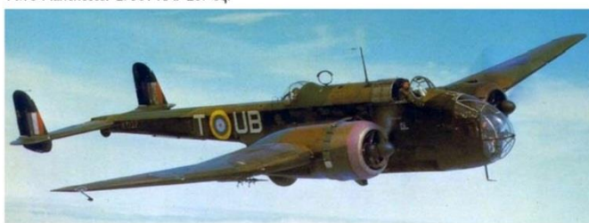
Handley Page Hampden AT137 RAAF 455 Sq.