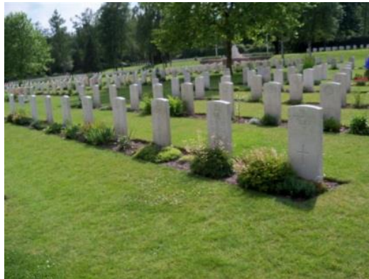
Foto 4 en 5: De Canadese Erebegraafplaats te Holten met op de voorgrond de graven van de bemanning van de Avro Manchester